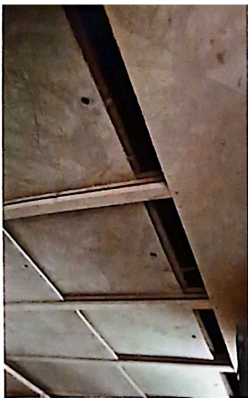
Links: binnenzicht van één van de vlieghokken. Midden boven: binnenzicht van de jonge duiven afdeling. Midden onder: door de roosters in de bakken zitten de duiven nooit in de mest. Rechts: deze stand van de verluchting blijft het hele jaar hetzelfde.