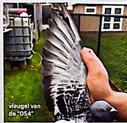
vleugel van de "054"