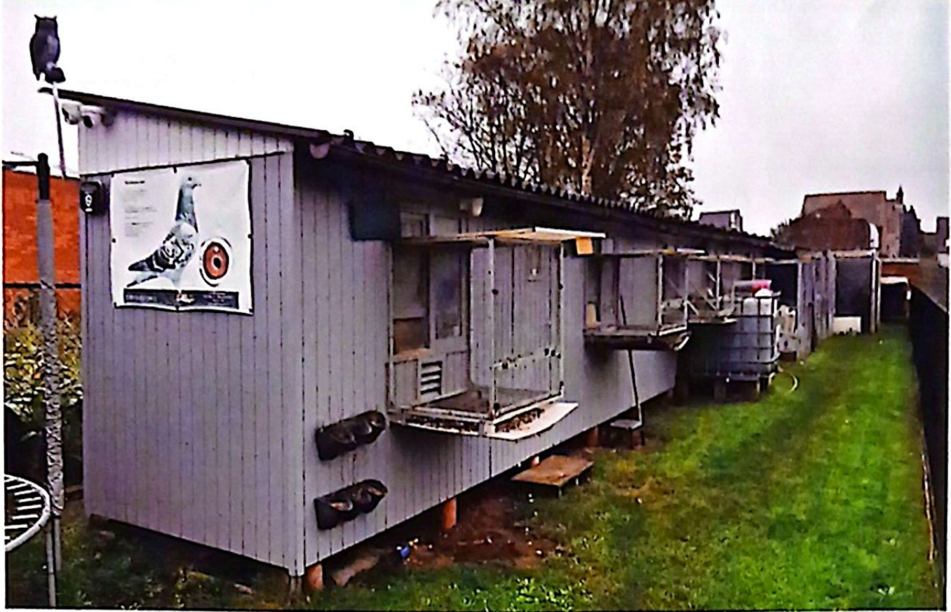
Links: overzicht van de hokinstallatie met het plat hellend dak. Van links naar rechts: 2 afdelingen voor de Barcelona duiven, 2 afdelingen voor de jaarse duiven, 1 afdeling voor de duivinnen, 3 afdelingen voor de jonge duiven. Rechtsboven: detail van de ventilatie van het plat hellend dak. Rechtsonder: verwarmingsplaat die tijdens de winter 1,5 uur per dag aangestoken worden.