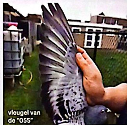
vleugel van de "055"